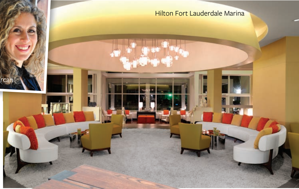
Hilton Fort Lauderdale Marina