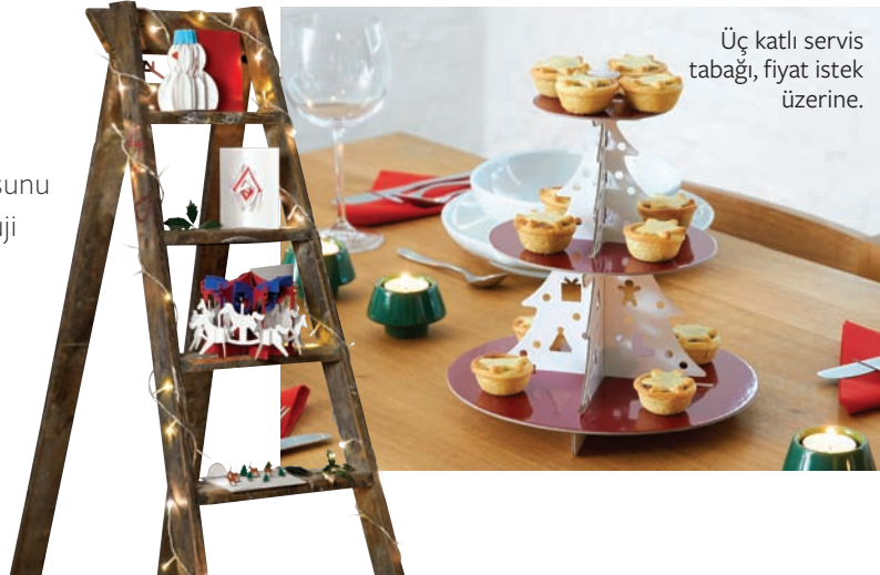
Üç katlı servis tabağı, fiyat istek üzerine.