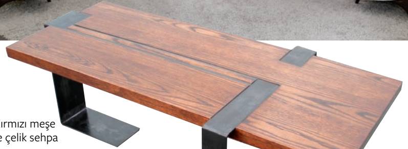
Kırmızı meşe ve çelik sehpa