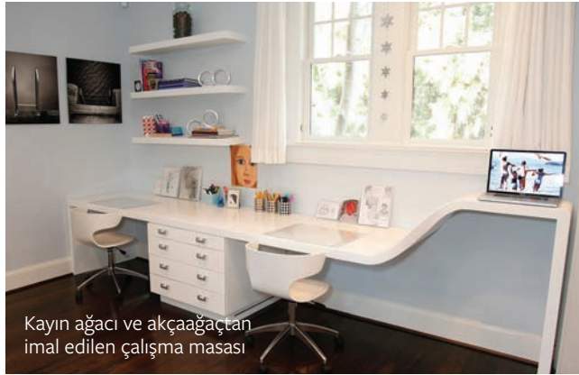
Kayın ağacı ve akçağaçtan imal edilen çalışma masası

(www.designwith3.com, www.ebruercan.com)