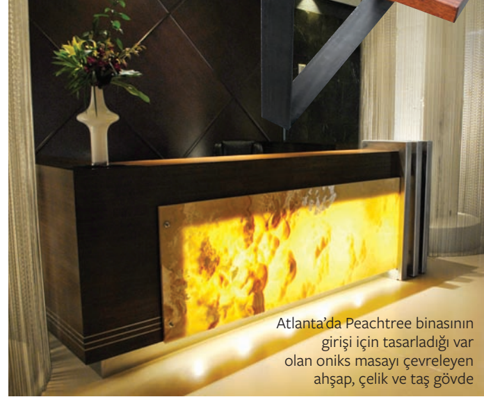
Atlanta'da Peachtree binasının girişi için tasarladığı var olan oniks masayı çevreleyen ahşap, çelik ve taş gövde